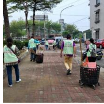
公園周邊清掃情形